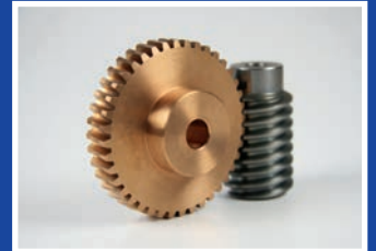
Schnecke und Schneckenrad