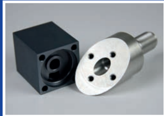
kombinierte Dreh- und Frästeile